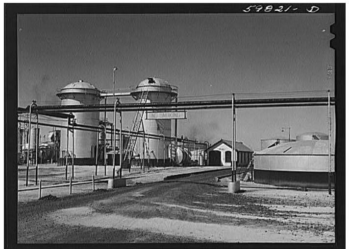
Wolcott, Marion Post. Barnsdall oil refinery. Kansas, 1941.

While refining is a complex process, the goal is straightforward: to take crude oil, which is virtually unusable in its natural state, and transform it into petroleum products used for a variety of purposes such as heating homes, fueling vehicles and making petrochemical plastics.