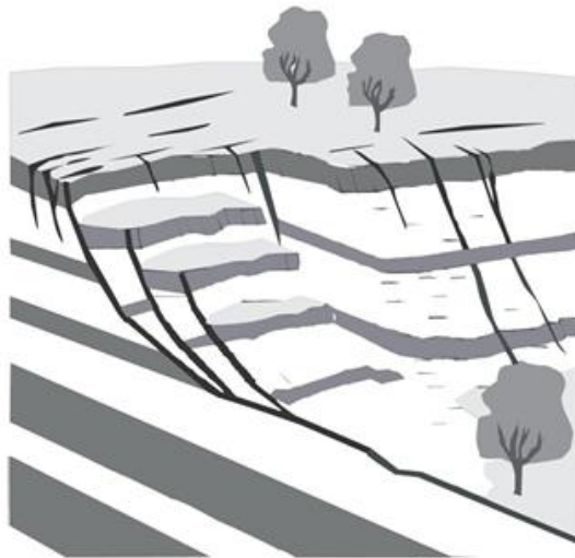
Fig. 6.5 Escorregamento rotacional