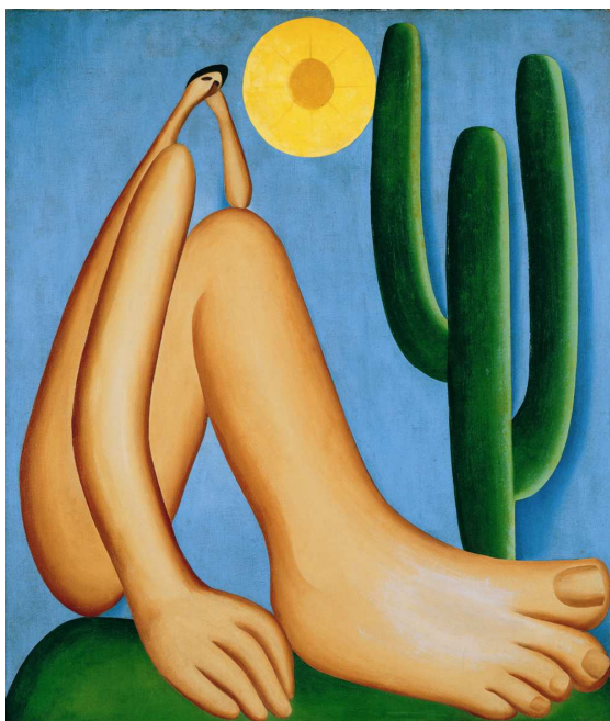
Abaporu, Tarsila do Amaral. IN. artedescreta.blogspot.com.br/2012/08/abaporu-de-tarsila-do-amaral.html.

A Comente e explique o significado das imagens do quadro Abaporu .