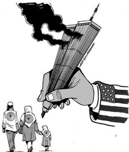
Charge do cartunista brasileiro Carlos Latuff. Ópera Mundi. 2011. www.ibahia.com