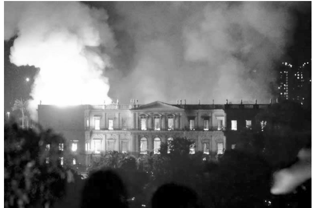
Museu Nacional em 2 de setembro de 2018, onde estava depositada grande parte das coleções de D. Pedro II. Folha de Londrina .

SCHWARCZ, Lília Moritz; DANTAS, Regina. O Museu do Imperador: quando colecionar é representar a nação. Revista do IEB, São Paulo, n. 46, fev. 2008, p. 154.