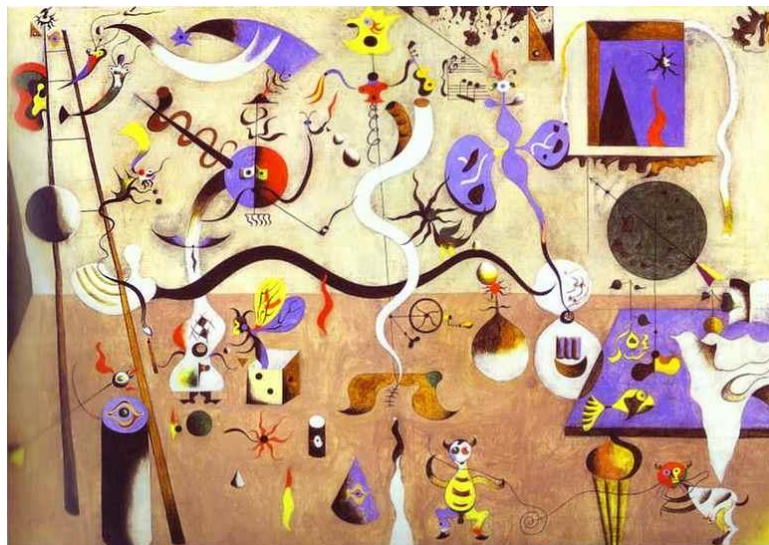
“Carnaval do Arlequim” (Joan Miró, 1925).