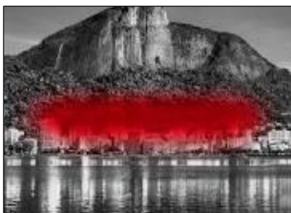
(Lygia Pape. Instalação Manto Tupinambá, 2000. Fogo de sinalização, infinitas dimensões.)

Lygia Pape (1927-2004), artista fluminense, foi um dos principais nomes da arte contemporânea. Por meio de sua obra é possível traçar a mudanças que a identidade nacional sofreu.