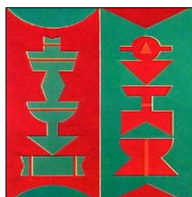
(Rubem Valentim. Emblema, 1987. Acrílico sobre tela.)

Sobre os artistas e as obras apresentadas anteriormente, assinale a afirmativa correta.