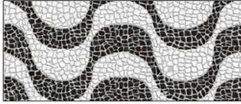
(Calçadão de Copacabana.)

Desenhado pelo paisagista Roberto Burle Marx, o calçadão da praia de Copacabana foi construído com pedras portuguesas em preto, branco e vermelho, montadas formando um desenho que representa as ondas do mar. A técnica usada pra a construção do calçadão, foi empregada pelos gregos e romanos, tendo se destacado durante o Império Bizantino.