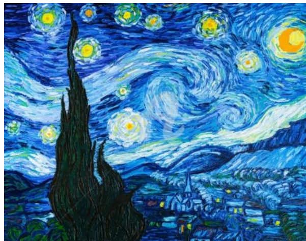
VINCENT VAN GOGH, THE STARRY NIGHT, 1889 (2021)

A obra "A Noite Estrelada" ("Starry Night") foi pintada por Vincent van Gogh e é amplamente reconhecida como uma representação icônica. Esta pintura retrata o céu noturno sobre a cidade de Saint-Rémy-de-Provence, na França, e apresenta elementos distintivos, como pinceladas expressivas e cores vibrantes. Considerando o contexto artístico, qual dos seguintes períodos artísticos é exemplificado pela obra "A Noite Estrelada"?