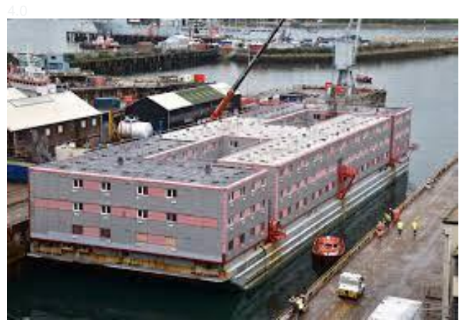
Foto da embarcação Bibby Stockholm , ancorada no porto de Portland no Reino Unido que, no ano de 2023, hospedou os imigrantes que chegaram ao país.