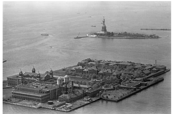
Foto de Ellis Island , ilha em Nova Iorque que recebeu durante os séculos XIX e XX imigrantes que chegavam à cidade. Serviu como lugar para o cumprimento de quarentenas, inspeções médicas e de asilo para imigrantes.

Foto da embarcação Bibby Stockholm , ancorada no porto de Portland no Reino Unido que, no ano de 2023, hospedou os imigrantes que chegaram ao país.