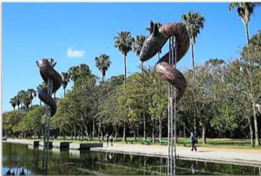
Figura 4 – “Entidades”, do artista macuxi Jader Esbell

QUESTÃO 30 – Observe a imagem apresentada na Figura 4 e a citação a seguir: