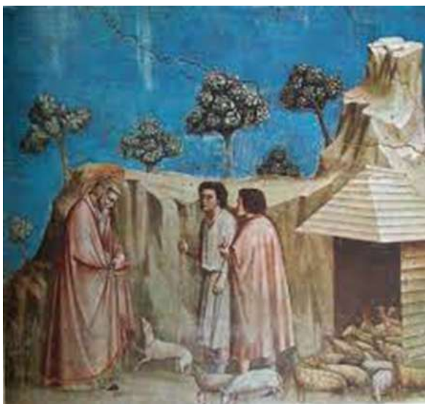
São Joaquim entre os pastores, Giotto, 1304.

A maior parte das obras que Giotto produziu foram afrescos que decoraram igrejas. Dentre essas pinturas estão, por exemplo, A Prédica diante de Honório III, para a igreja de São Francisco, em Assis, e O Juízo Final, para a capela dos Scrovegni, em Pádua. Assim sobre a obra de Giotto: