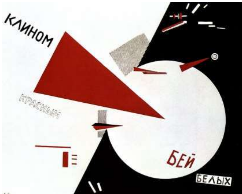
Figura 1 – “Golpeie os brancos com a cunha vermelha” (El Lissitzky, 1919).

QUESTÃO 36 – Analise a Figura 1, a seguir: