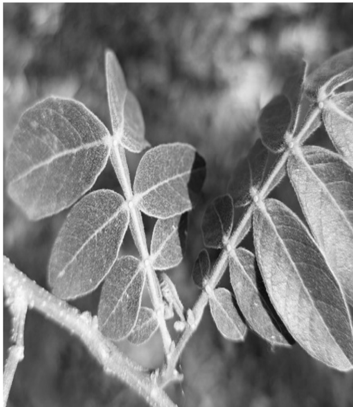
Foto 02: As folhas são divididas em folíolos e, entre cada par deles, é possível visualizar pequenas bolinhas que produzem néctar