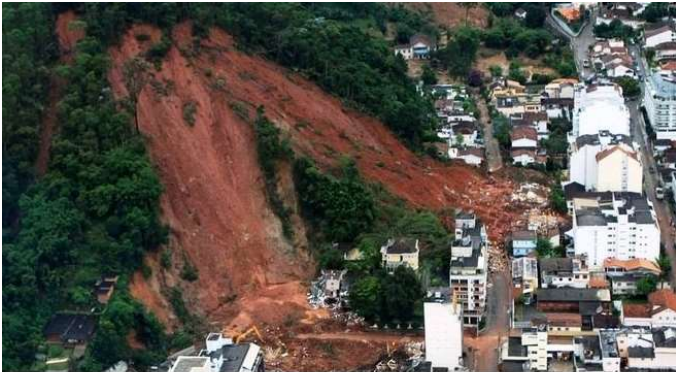
Deslizamentos de terra são os mais frequentes problemas geológicos no país

Disponível em: < https://www.r7.com/CO7z >. Acesso em: 28 ago. 2023.