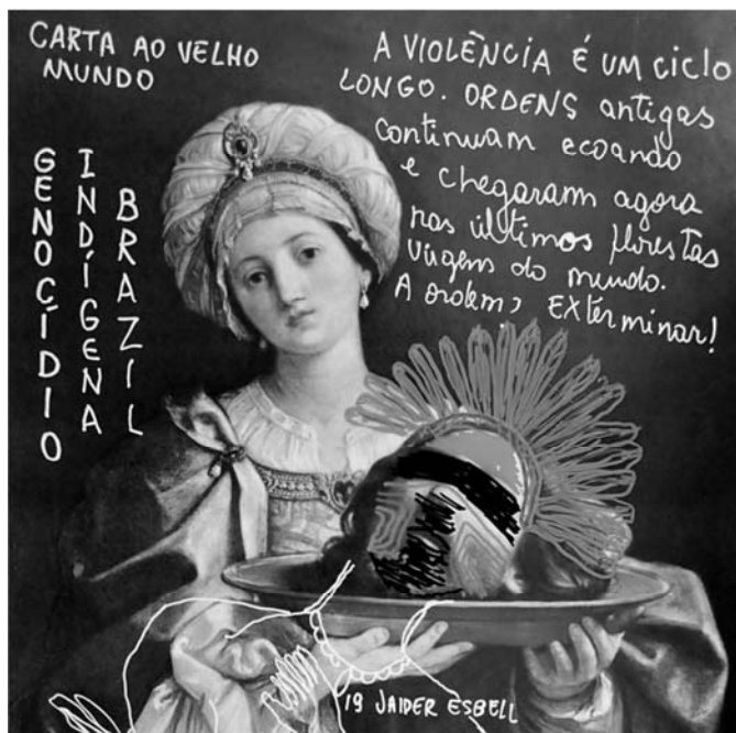
Jaider Esbell. Carta ao velho mundo (detalhe), 2018/2019.

A história da arte encadeia sequências de obras como narrativas sobre técnicas e materiais, estilos e temáticas. Com isso, às vezes, são suscitadas narrativas polêmicas sobre gênero e sexualidade; raça e etnia; contextos de opressão e opulência; representação e invisibilidade.