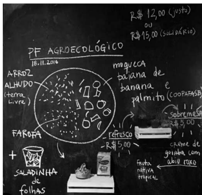
Jorge Menna-Barreto. Restauo . Escultura-ambiental/restaurante. 2016. Registro diário, com giz branco na lousa escolar, do prato agroecológico do dia, feito a partir das cestas de agricultura familiar sustentável, vendido como opção de almoço, no pavilhão da Bienal de São Paulo.

Convidado a propor uma obra para 32. a Bienal de São Paulo, o artista Jorge Menna-Barreto explica que esse projeto “levanta questões acerca da construção dos hábitos alimentares e sua relação com o ambiente, a paisagem, o clima e a vida na terra (...) onde é possível perceber um outro momento da vida dos alimentos que chegam até nós. Restauo propõe um despertar para os usos da terra e as consequências globais de nossas escolhas. Entendendo o nosso sistema digestivo como ferramenta escultórica, os comensais tornam-se participantes de uma escultura ambiental em curso na qual o ato de se alimentar regenera e modela a paisagem em que vivemos”.