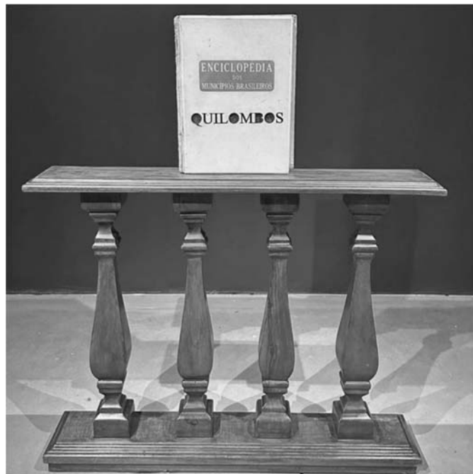
Sérgio Adriano H. Enciclopédia de Municípios Brasileiros Quilombos . Objeto. 2023. Livro Enciclopédia dos Municípios Brasileiros recortado com a palavra QUILOMBOS, páginas coladas preenchidas com cola e terra do Quilombo dos Palmares, sobre divisória colonial.

A diversidade cultural vem acompanhada de narrativas identitárias que redimensionam a historiografia da arte brasileira. Assim, é inevitável e até mesmo desejável o confronto e a confluência entre mundos sociais e valores que podem apresentar diferentes versões, contradições e imprecisões sobre os mesmos fatos, eventos e acontecimentos.