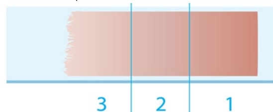
Regiões: 1 - Cabeça, 2 - Corpo e 3 - Cauda

O esfregaço de sangue é um teste realizado em hematologia para a contagem e a identificação de anormalidades nas células sanguíneas. Para essa técnica é utilizada uma mistura especial de corantes para tingir todas essas células. A afinidade das estruturas celulares por corantes específicos ou por combinações de corantes dessa mistura proporciona uma visualização diferenciada das células sanguíneas. A figura abaixo mostra as diferentes regiões formadas na lâmina microscópica devido ao esfregaço de sangue, onde se localizam tipos celulares distintos.