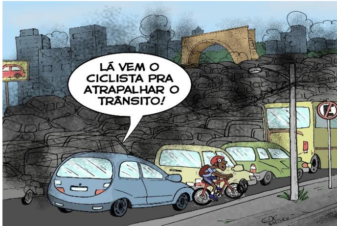
Charge de Ede Galileu produtor cultural e arte educador https://passapalavra.info/2021/11/140889/

7. Muitas das vezes, as charges são críticas carregadas de humor. Na charge apresentada, o humor acontece porque a fala do motorista: