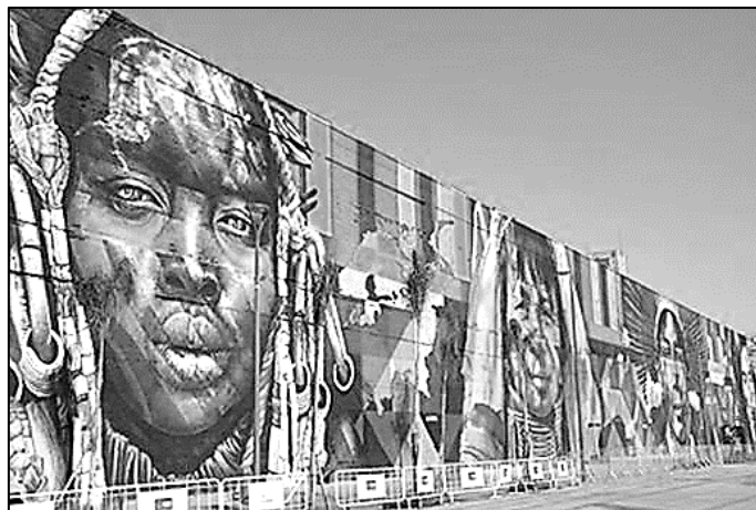
(Obra de Eduardo Kobra – Etnias: Todos somos um. Rio de Janeiro, 2016.)

Ela é uma fotografia da obra “Todos somos um” de Eduardo Kobra; nela, o artista representa os povos nativos dos cinco continentes. O estilo artístico exemplificado pela obra tem como característica ser expressada em paredes com o uso tinta em spray e, as vezes, stencil , normalmente em espaços públicos. O contexto geralmente traz narrativas da cidade, envolvendo questões sociais e propondo críticas e reflexões por meio da arte nos muros. O nome dado a tal expressão artística é: