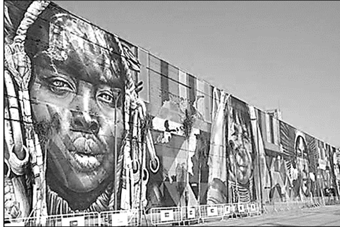
(Obra de Eduardo Kobra – Etnias: Todos somos um. Rio de Janeiro, 2016.)

Ela é uma fotografia da obra “Todos somos um” de Eduardo Kobra; nela, o artista representa os povos nativos dos cinco continentes. O estilo artístico exemplificado pela obra tem como característica ser expressada em paredes com o uso tinta em spray e, as vezes, stencil , normalmente em espaços públicos. O contexto geralmente traz narrativas da cidade, envolvendo questões sociais e propondo críticas e reflexões por meio da arte nos muros. O nome dado a tal expressão artística é: