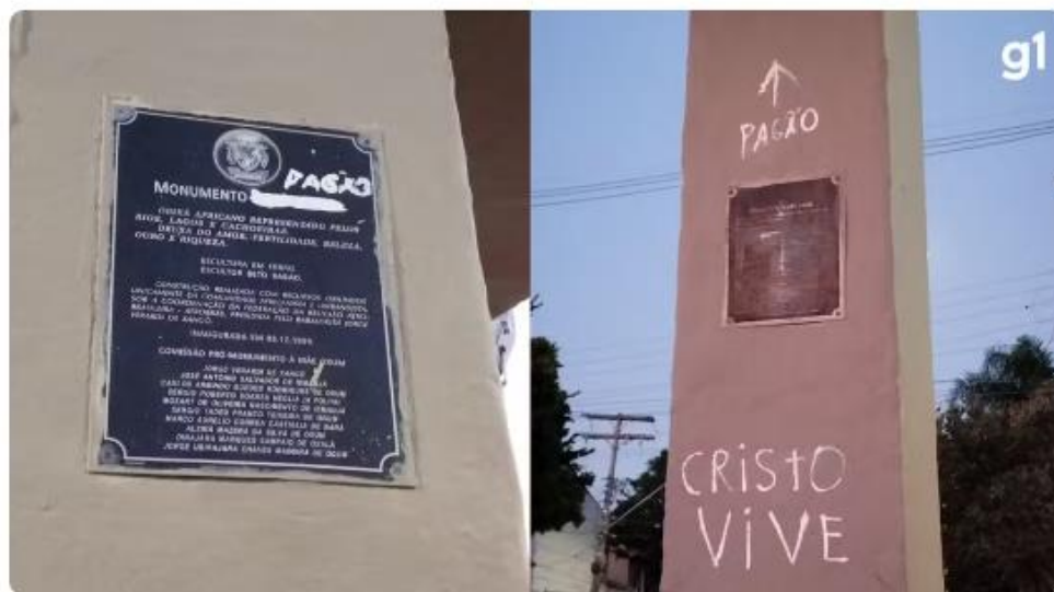
Pichações apareceram em monumento de Mãe Oxum em Porto Alegre

O caso relatado acima demonstra um ato de: