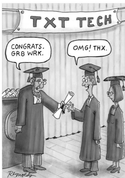
Figure 1 The future of English?

32. “Language is a communicative tool manipulated by speakers within social networks, for communities and societies vary. Thus, language and its functions are changed”. Based on the statement provided, check the answer that better explains the picture below.