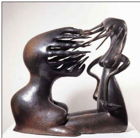
(O Impossível. Maria Martins. 1945.)

A obra “O Impossível” foi produzida pela escultora, desenhista, gravadora, escritora brasileira Maria Martins (Campanha, Minas Gerais, 1894 – Rio de Janeiro - RJ, 1973). Assinale a afirmativa correta em relação à artista Maria Martins.