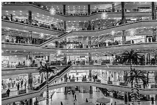
Shopping em Istambul (Turquia), um dos Ícones do Consumo

Essa postura consumista surgiu a partir da Revolução Industrial no século XVIII, de forma que os processos industriais possibilitaram o aumento da produção e, conseqüentemente, do consumo de produtos.