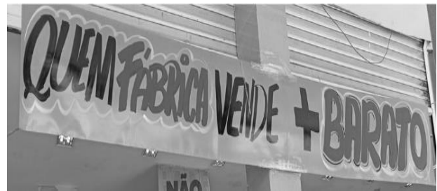
Fotografado no dia 04/04/2024

A faixa, acima, está exposta em uma loja do centro comercial de um município pernambucano. De acordo com a frase do texto, é CORRETO afirmar que: