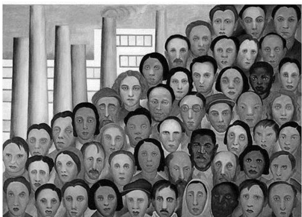
Quadro “Operários” de Tarsila do Amaral. Óleo sobre tela, 1933.

A ideia de “raça” surge em Interpretação do Brasil – às vezes par a par com a noção de “etnia” – é a mesma elaborada por Gilberto Freyre em Casa-grande e Senzala. Com efeito, não temos um simples fortalecimento da ideia de “cultura” em detrimento da noção de “raça”. É produto de uma relação dinâmica entre meio e história, migrações e contatos étnicos, teríamos a formação de uma raça histórica, que, de sua parte seria promotora de transformações históricas inerentes ao seu padrão de comportamento.