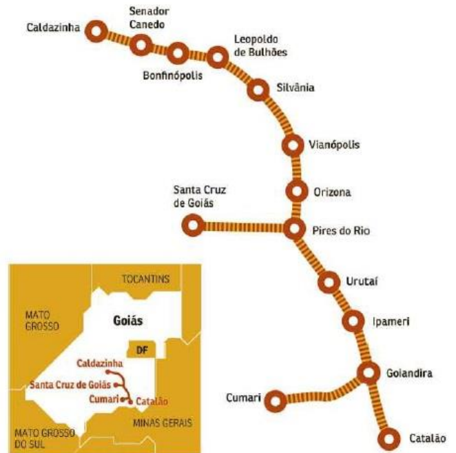
Disponível em: < https://www.correiobraziliense.com.br/app/noticia/cidades/2019/07/31/interna-cidadesdf,774642/goias-planeja-reativar-antiga-estrada-de-ferro-como-atracaoturistica.shtml >. Acesso em: 29 fev. 2024.

O projeto do trem turístico em Goiás contempla 14 cidades