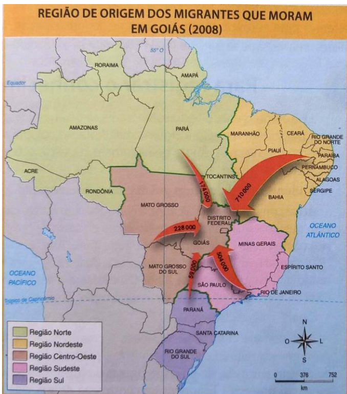
OLIVEIRA, Ivanilton José. Geografia de Goiás . Ensino Fundamental. Tadeu Arrais. São Paulo, Editora Scipione.

A leitura do mapa de 2008 sobre a origem dos migrantes que moram em Goiás mostram que, naquela década, a maior parte das pessoas vieram de