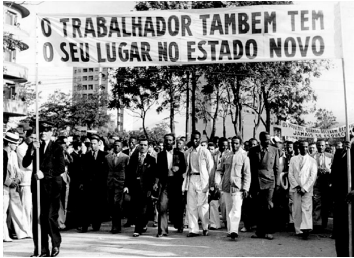
Homenagem a Getúlio Vargas na Esplanada do Castelo. Rio de Janeiro (09/11/1940).

23. O Estado Novo (1937-1945), implantado e governado por Getúlio Vargas, concluiu o longo período em que Vargas esteve à frente da presidência no Brasil, totalizando 15 anos seguidos, e que ficou conhecido como Era Vargas. Seu início ocorreu ao liderar a “Revolução de 1930” e seu desfecho, em outubro de 1945, quando foi destituído da presidência. A Segunda Guerra Mundial (1939-1945) foi um dos acontecimentos marcantes à época.