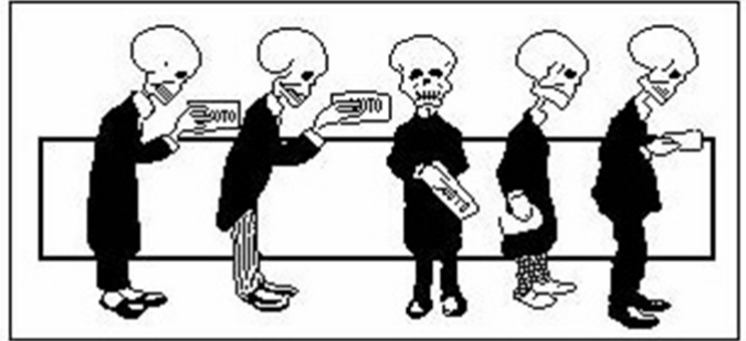
Detalhe da Charge Como se faz uma eleição , de Amaro. Revista da Semana, nº 495, 1909, Rio de Janeiro. Biblioteca Nacional.

A charge, datada do início do século XX, que retrata uma das características políticas predominantes da Primeira República no Brasil (1889-1930), também conhecida como República Velha, refere-se: