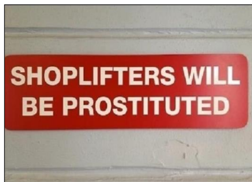
(Available in: https://teylarachelbranton.com. )

Examine the placard in order to indicate the assertion matching it