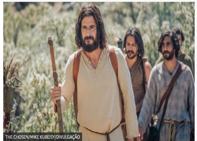
'The Chosen' é a primeira série de TV que conta a história de Jesus Cristo em diversas temporadas

Leia o texto a seguir e responda às questões 4 a 7.