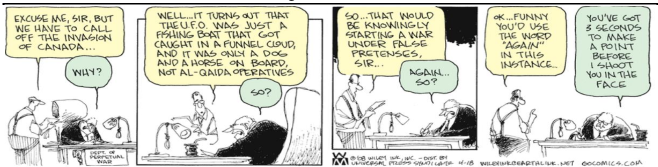
Available at: https://www.gocomics.com/nonsequitur/2008/04/18

Analyze the dialogue presented in the comic strip. The phrase “call off” in the first panel can be replaced by which of the following words without changing the meaning of the sentence?