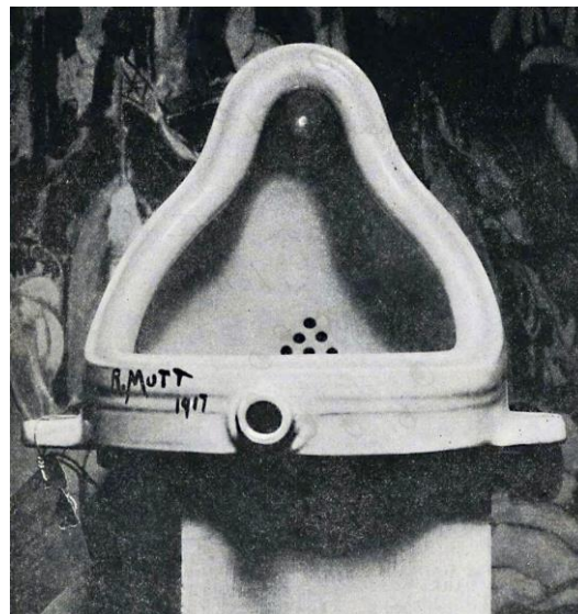
“A Fonte” ( Fountain ), de Marcel Duchamp”.