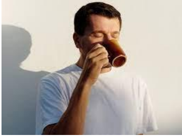
Conversinha mineira: (Fernando Sabino).

Leia o texto para responder às próximas duas questões.