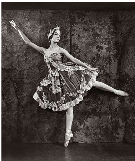
Olga Spessivtseva no papel de Aurora (Bela Adormecida, 1921 Coleção E.O. Hoppé/Fornecido pela editora "Iskusstvo - XXI vek"

Disponível em : https://br.rbth.com/cultura/80950-divas-bale-russo