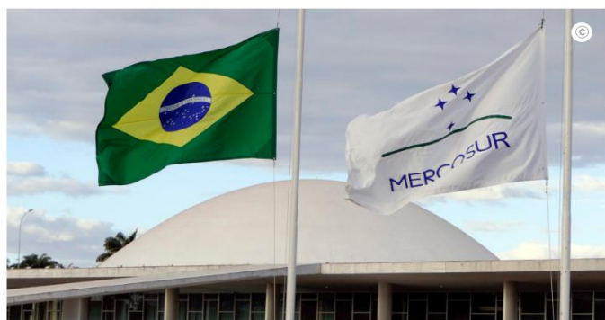
Bandeira do Brasil e do Mercosul e, ao fundo, o Congresso Nacional

Proposta foi aprovada por 323 a 98 e segue ao Senado; adesão do país ao bloco precisa do aval de Argentina, Brasil, Paraguai e Uruguai