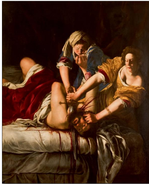
Judite decapitando Holofernes (Gentileschi, 1621).

Artemisia Gentileschi foi uma pintora barroca cuja obra foi marcada por seus dramas pessoais. Suas pinturas até hoje causam grande impacto. Nesse sentido, são características da arte barroca: