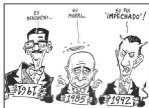
(NOVAES. Carlos E. & LOBO. César. História do Brasil para Principiantes: 500 anos de idas e vindas, p.221, 2002)