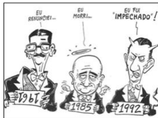
(INOVAES. Carlos E. & LOBO. César. História do Brasil para Principiantes: 500 anos de idas e vindas, p.221, 2002)

A charge apresentada anteriormente faz alusão a três ex-presidentes brasileiros e aos respectivos acontecimentos