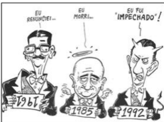
(NOVAES. Carlos E. & LOBO. César. História do Brasil para Principiantes: 500 anos de idas e vindas, p.221, 2002)

A charge apresentada anteriormente faz alusão a três ex-presidentes brasileiros e aos respectivos acontecimentos que mais marcaram suas trajetórias políticas. A partir disso, assinale a alternativa que apresente sequencialmente suas identificações: