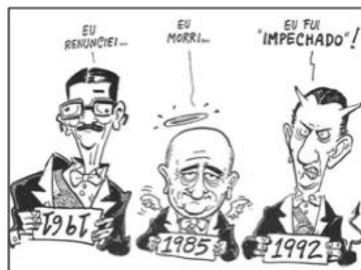
(NOVAES. Carlos E. & LOBO. César. História do Brasil para Principiantes: 500 anos de idas e vindas, p.221, 2002)

A charge apresentada anteriormente faz alusão a três ex-presidentes brasileiros e aos respectivos acontecimentos que mais marcaram suas trajetórias políticas. A partir disso, assinale a alternativa que apresente sequencialmente suas identificações: