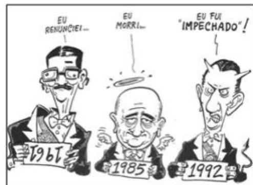
INOVAES. Carlos E. & LOBO. César. História do Brasil para Principiantes: 500 anos de idas e vindas, p.221, 2002)

A charge apresentada anteriormente faz alusão a três ex-presidentes brasileiros e aos respectivos acontecimentos que mais marcaram suas trajetórias políticas. A partir disso, assinale a alternativa que apresente sequencialmente suas identificações: