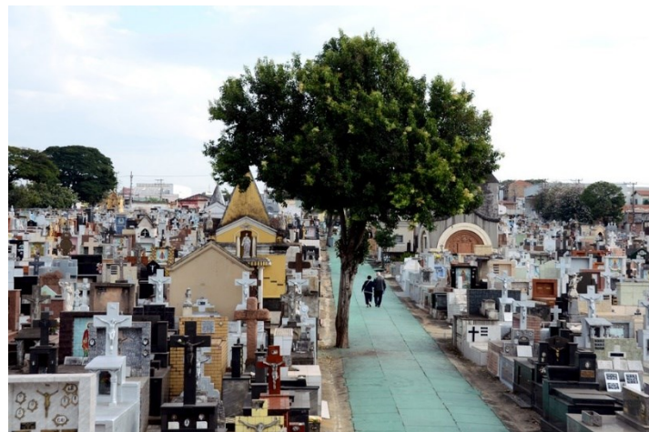
(Cemitério de Sorocaba-SP).

A palavra cemitério é originária do grego koumeterian e do latim coemeterium . Significa dormitório, lugar onde se dorme, recinto onde se enterram e guardam os mortos. De acordo com a imagem mostrada a seguir, marque a opção que demonstre o tipo de cemitério ilustrado a seguir.