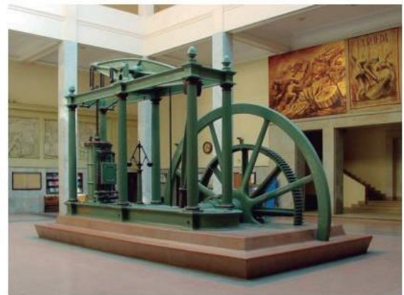
Figura 2.6: Exemplo de máquina a vapor alimentada por carvão e utilizada até o início do século XX.

A figura acima é um exemplo de máquina a vapor alimentada por carvão e utilizada até o início do século XX. Esse instrumento de produção nos remete a: