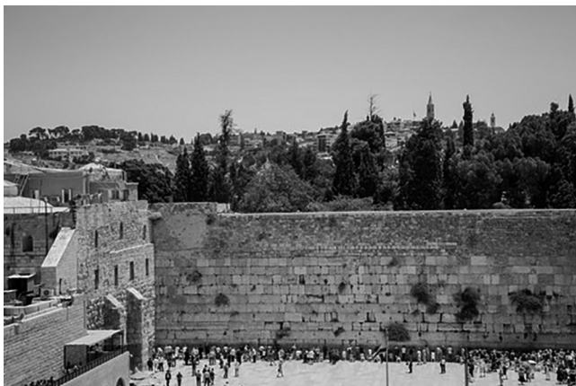
Muro das Lamentações.

O professor do componente Ensino Religioso e a professora do componente Geografia planejaram uma aula integrada, na qual abordaram o tema dos espaços e territórios religiosos e socioculturais a partir da análise sobre a cidade de Jerusalém e os lugares sagrados para os monoteísmos – Judaísmo, Cristianismo e Islamismo. Na consulta ao livro de Geografia, a turma identificou a foto do Muro das Lamentações como um dos espaços sagrados e território sociocultural para o Judaísmo, conforme imagem a seguir. Em seguida, os estudantes perguntaram ao professor do Ensino Religioso o motivo pelo qual o livro era sagrado para a religião judaica.