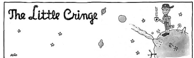
ITURRUSGARAI, Adão. A vida como ela yeah. Folha Cartum , 24 de novembro de 2021. Disponível em: http://f.i.uol.com.br/folha/cartum/images/2132714.jpeg .