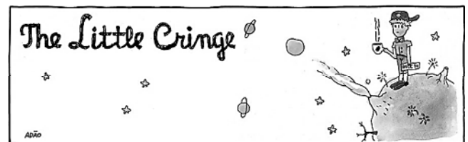
ITURRUSGARAI, Adão. A vida como ela yeah. Folha Cartum , 24 de novembro de 2021. Disponível em: http://f.i.uol.com.br/folha/cartum/images/2132714.jpeg .