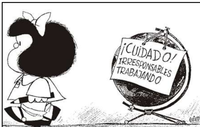
Mafalda

Analise a tirinha de Mafalda. Ela está de costas, após escrever no cartaz: "Cuidado! Irresponsáveis trabalhando" – preso ao Globo Terrestre.