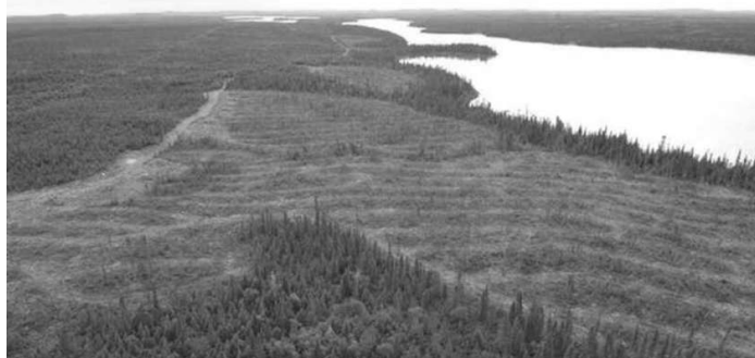
Uma parte da floresta boreal no Canadá, junto ao rio Broadback.

Poluição está a tornar mais opaca a atmosfera da floresta boreal, impedindo o normal ciclo da fotossíntese. E o maior reservatório de CO 2 do planeta está a regredir.