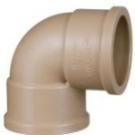
Foto da peça com vazamento

24. Você chegou ao banheiro e se deparou com um vazamento de um encanamento. Ao verificar percebeu que uma peça estava com rachadura (foto abaixo) e relatou ao setor de compras qual peça deve ser comprada para substituição. Assinale a alternativa que corresponde ao nome da peça: