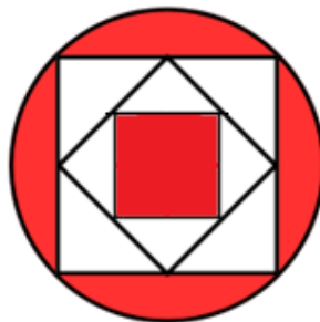
Figura fora de escala

QUESTÃO 28 – Na figura a seguir, os pontos em comum dos vértices dos quadrados internos são os pontos médios dos lados dos quadrados externos, e o diâmetro da circunferência que os circunscribe é \sqrt{2} cm. Pode-se concluir corretamente que a área do quadrado vermelho interno é: Se necessário, considere que \sqrt{2} = 1,4 .